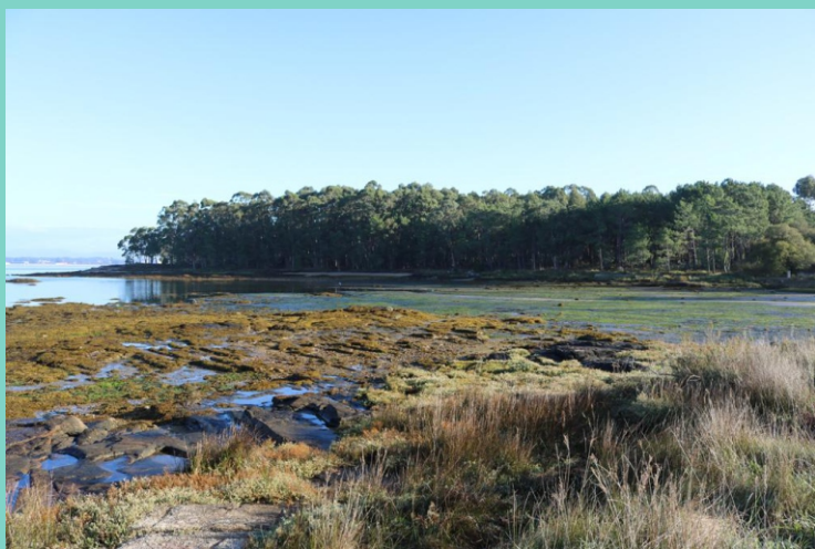
Vista desde Con de Xido cara á punta das Laxes

A volta pódese facer polo mesmo camiño ou por pistas interiores polas que se acurta a distancia.