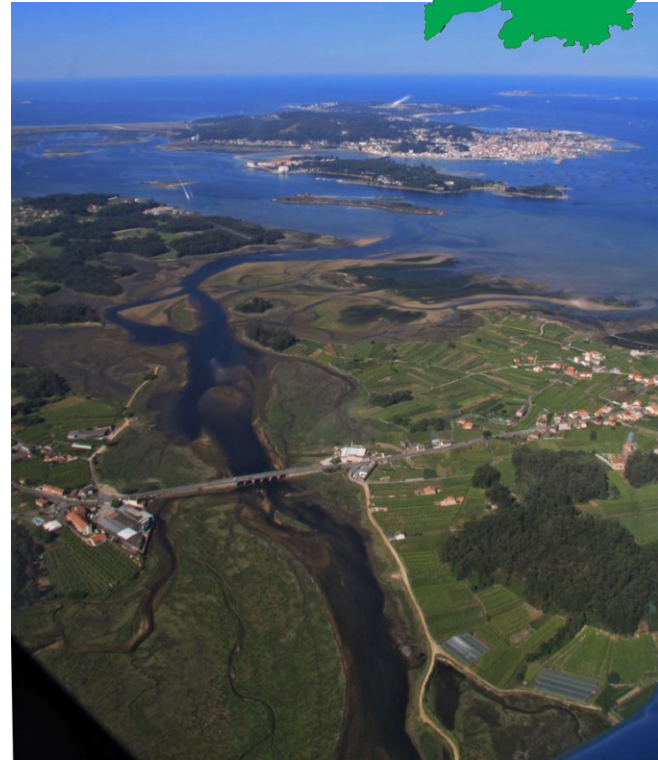
Río Umia. Desembocadura, esteiro e enseada. Ao fondo os areas do Serrido e Correlo. A Toxa Pequena, A Toxa e O Grove