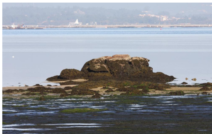
Punta e praia de Correlo