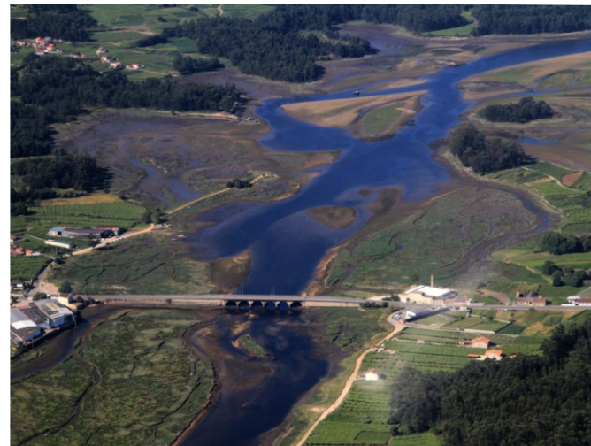
Ponte da Barca sobre o río Umia. Á esquerda o comezo da costa de Castrelo. no interior do esteiro