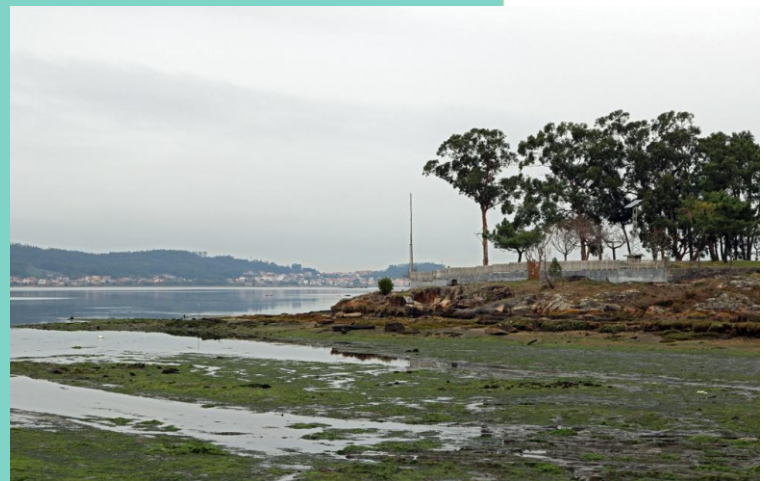
Punta do Becho. Rego do Francón