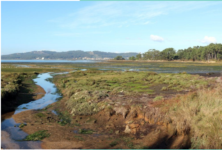
Enseada do Couto de Abaixo