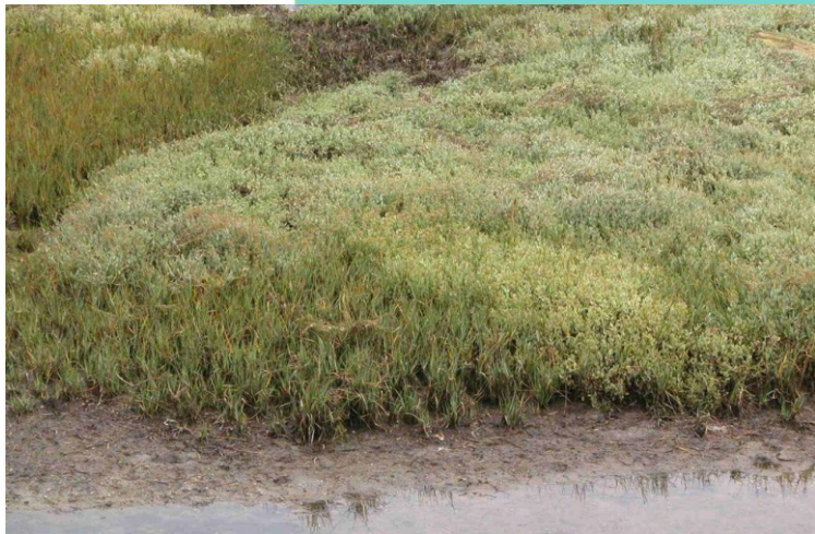
Vexetación típica de esteiros e enseadas: espartina, portulaca, xuncos...