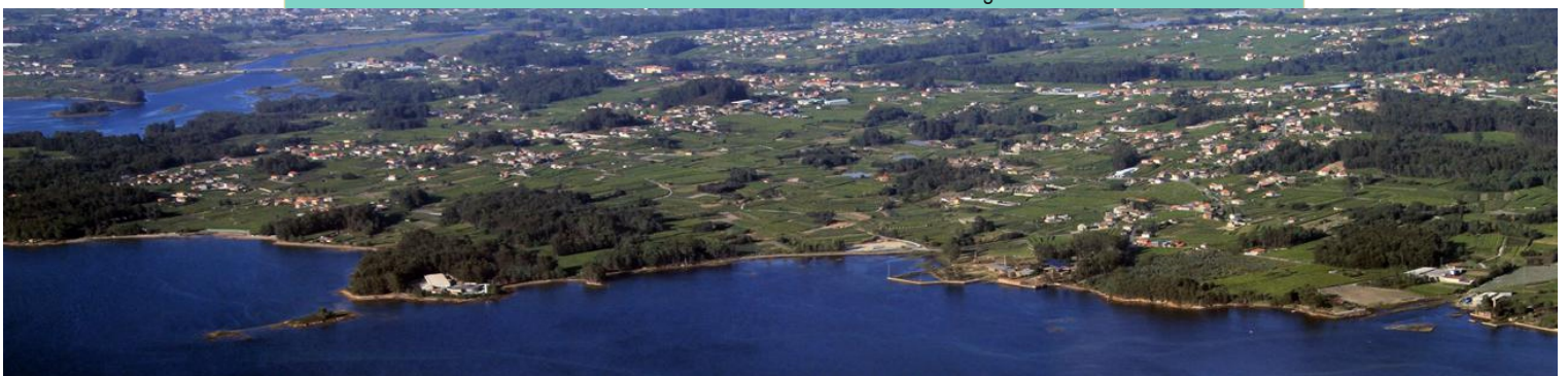
Vista aérea da costa de Castrelo