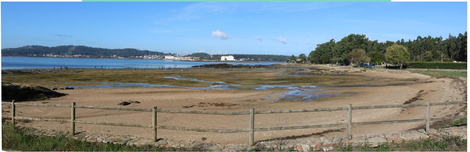
Praia de Fontiñas. Ao fondo As Saiñas.