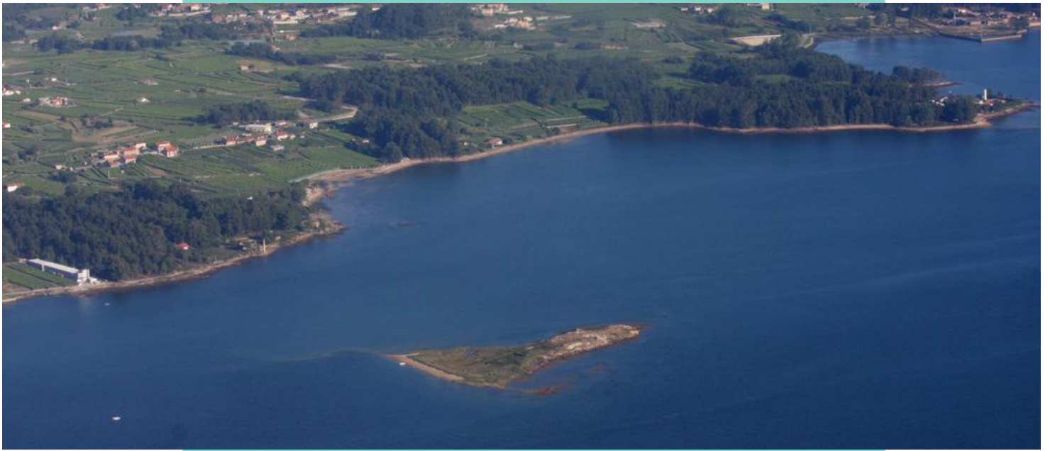
O Beiró e a costa do Facho