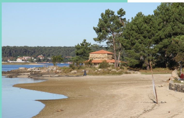
Praia das Saiñas