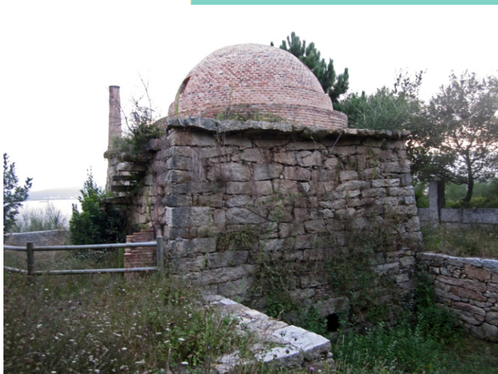
Telleira de Vieites, recentemente reconstruída