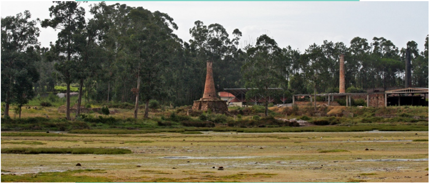
Enseada do Couto de Abaixo e restos dunha telleira na fábrica de Cerámica