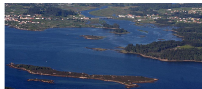
A Toxa Pequena e a punta de Correlo

O concello de Cambados atópase, en boa parte, no esteiro do Umia, á beira da ría de Arousa. Ten unha costa abrigada e recortada que alterna areas, rochedos, pequenas praias e esteiros; de augas calmas e de pouca profundidade e grandes áreas que quedan en seco coa marea baixa, que acollen ricos bancos marisqueiros.