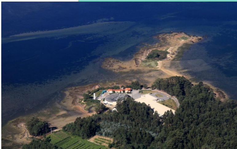
Punta de Bico da Ran