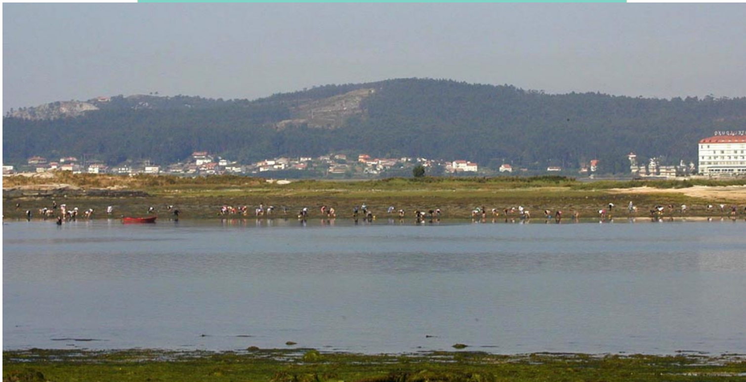
Bancos marisqueiros de Castrelo coa Toxa Pequena ao fondo