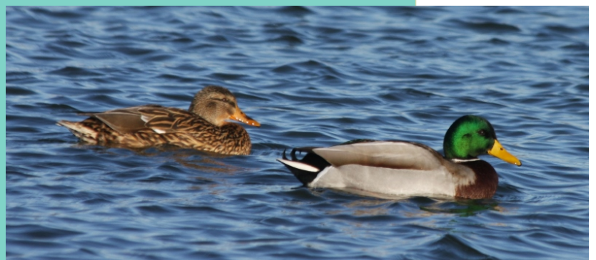
Mazarico e lavanco, dúas aves representativas da costa de Castrelo